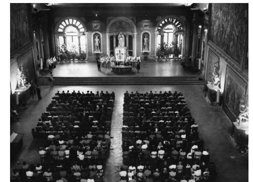
Welcome Reception for the First World Congress on Pain, held at the Palazzo Vecchio in Florence, Italy.